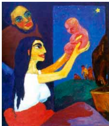
Emil Nolde: Julenat . 1911/12. Olie på lærred. Stiftung Seebüll.