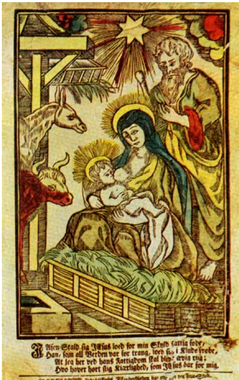
“I Asenstald.” Ca. 1800. Koloreret træsnit.